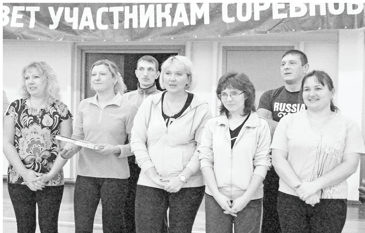
Победитель «Веселых стартов» — команда «Спортивные черепахи».